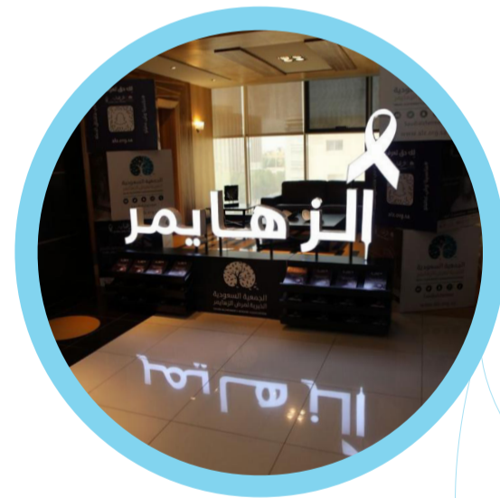
مجلس الزهايمر التعريفي

تتواجد معالم ألزهايمر في عدد من المراكز والمجمعات والقطاعات الحيوية في كافة مناطق المملكة، لزيادة الوعي بالحملة وتسليط الضوء على أعراض ومراحل وأهمية التشخيص المبكر للمريض وتسخير وتسهيل الإجراءات والتحديات التي تواجه مقدمي الرعاية وكل ما من شأنه أن يخفف ويساند الأسرة.