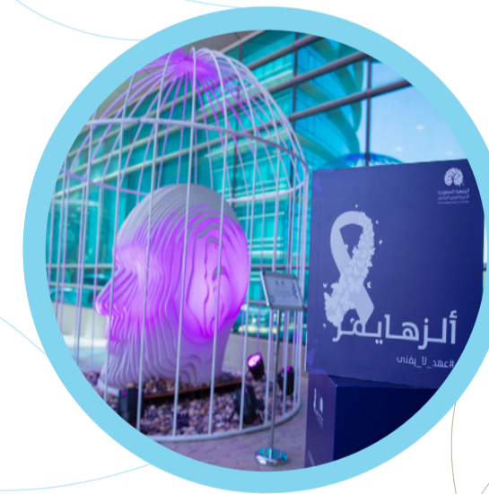
مجسم الرؤية مريض ألزهايمر